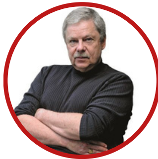
Xavier Raufer Criminologue

La radiographie criminelle de la France incombera donc à RÉEL CRIMINEL, dont la base documentaire accumule chaque mois des milliers de faits et données tous sourcés et recoupés avec soin. Sa mission : d'ici l'élection présidentielle (2027 par hypothèse), divulguer la réalité criminelle aux publics intéressés.